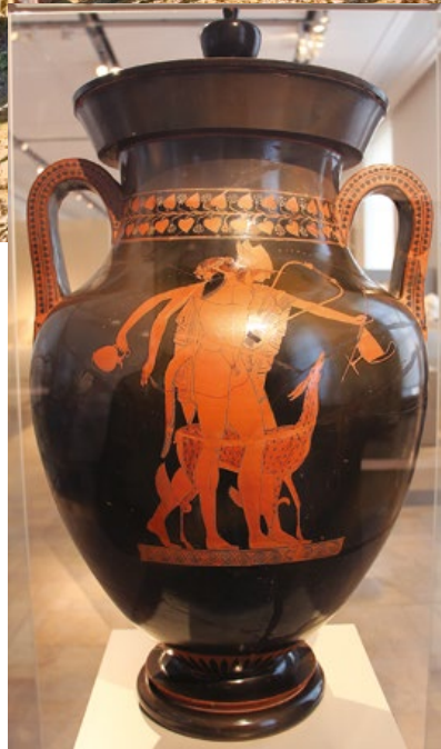
Ελλῶς με Ερμή και Σάτυρο Ζωγράφος του Βερολίνου