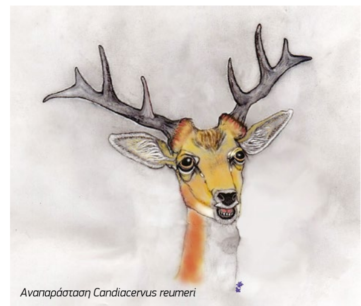
Αναπαράσταση Candiacervus reumeri

Να αποθανάτιζε, άραγε, ο ζωγράφος 'του Λούβρου' το ελάφι στο μέγεθος και τα χρώματα που το είδε; Ελπίζω να το μάθουμε κάποια στιγμή... Εν πάση περιπτώσει, είδη ζώων που έχουν εξαφανιστεί μας κάνουν να φανταζόμαστε διαφορετικές γίνεσες