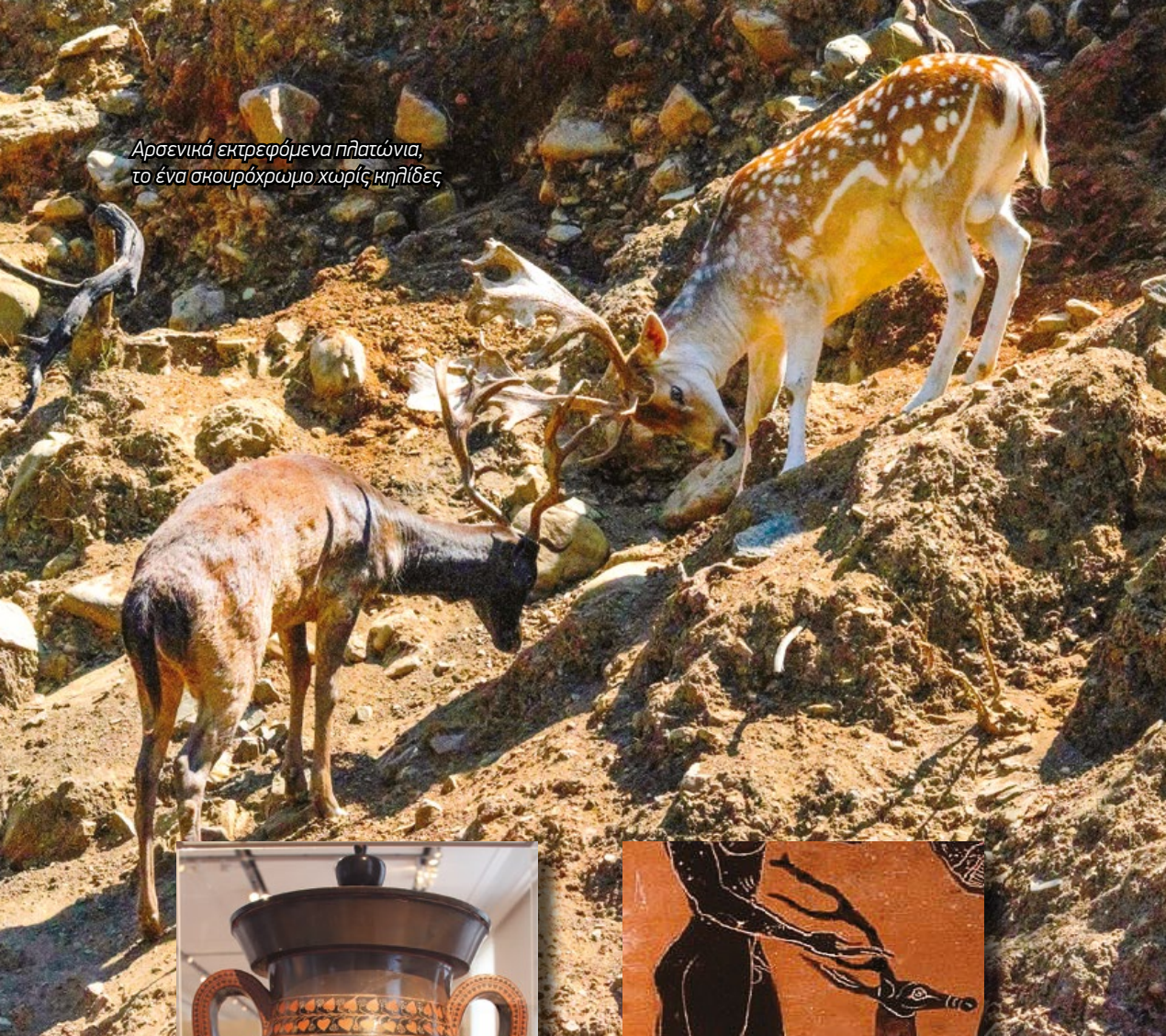
Αρσενικά εκτρεφόμενα πλάτωνια, το ένα σκουρόχρωμο χωρίς κηλίδες