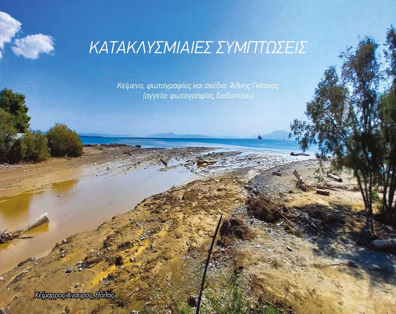
Χείμαρρος Άναυρος, Βόλος

Κείμενο, φωτογραφίες και σχέδιο: Άλκης Γκέσκος (αγγεία: φωτογραφίες διαδικτύου)