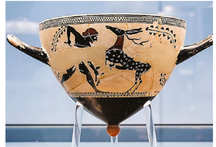
Ηρακλής κι ενήλιχο αρσενικό πλάτωνι Τεχνοτροπία Ψίακος

ατμόσφαιρες, ουρανούς και φεγγάρια σε ένα πιο φυσικό περιβάλλον. Κι ο σύγχρονος άνθρωπος έχει, πια, αντιληφθεί τη σημασία της προστασίας της φύσης. Έτσι, οι επεμβάσεις του σε ξηρά, θάλασσα κι αέρα έχει αποφασιστεί να γίνονται με εξελεγχόμενη μεθοδολογία, τεχνικές και υλικά. Συχνά, βέβαια, δεν είναι καλά μελετημένες ή δεν πραγματοποιούνται σωστά. Με δεδομένη την κλιματική αλλαγή, δεν είναι αφύσικο να καταλήγουν σε τραγωδίες όπως έγινε φέτος στη Θεσσαλία ή, σε τοπικό επίπεδο, πέρυσι, στην Αγία Πελαγία. Το ζήτημα είναι πότε θα εφαρμοστούν, επιτέλους, όλα τα πρέποντα ώστε το μέλλον μας να μην καθορίζεται από μικρά και μεγάλα συμφέροντα... ■